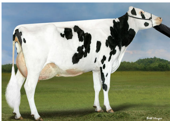
PROGENESIS DUKE MELEE GRANDDAM