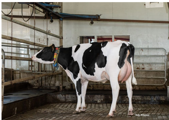
PROGENESIS MAVERICK MOVER DAM