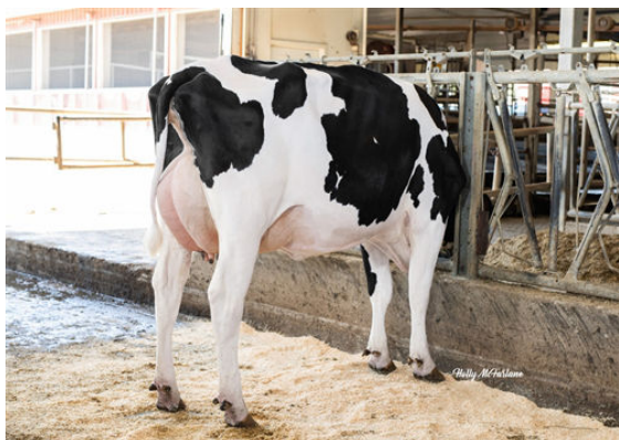
PROGENESIS MAVERICK MOVER DAM